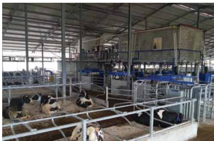
IMAGEM 1 ▲ ▲ IMAGEM 2

COLOCOU EM FUNCIONAMENTO OS PRIMEIROS 6 ROBOTS NA EXPLORAÇÃO AGRÍCOLA TEIXEIRA DO BATEL EM VILA DO CONDE